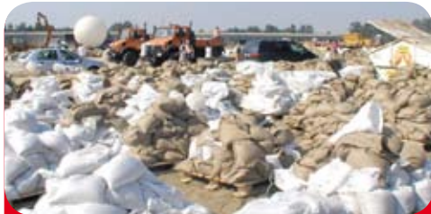
Die Bilder scheinen immer wiederzukehren: Berge von Sandsäcken, dazwischen schweres Gerät, um gegen die Hochwasser-Fluten anzukämpfen

Extreme Niederschläge haben in diesem Jahr dazu geführt, dass sich an Oder, Neiße, Spree und Schwarzer Elster Hochwasserkatastrophen entwickelten. Und dazu kam noch das Binnenhochwasser an der Oder. Das macht deutlich: Hochwasserschutz und Hochwasser-Risiko-Management sind eine unverzichtbare Aufgabe zum Schutz der Bevölkerung. Umweltministerin Anita Tack (DIE LINKE) ist bereits aktiv. Gegenwärtig bereiten wir dazu eine Kabinetttvorlage vor. Sie beschäftigt sich mit der weiteren Verbesserung des Hochwasserschutzes. Unser Ansatz ist, den Flüssen wieder mehr Raum zu geben. In einem Entschließungsantrag der Koalitionsfraktionen zum Hochwasser