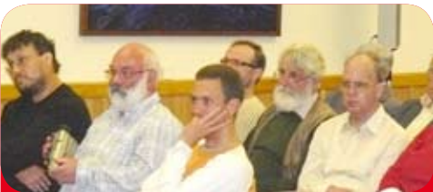
Haben für ehrlichen Dialog zwischen Politik und Bevölkerung offene Ohren: Besucherinnen und Besucher des finanzpolitischen Abends in Rathenow

Das ist oft nicht gerade gemütlich. Doch wir tun das, auch und gerade dann, wenn sich besorgter Widerstand von Betroffenen formiert: zum Beispiel der linke Wirtschaftsminister auf Ortsterminen, besonders beim Energiedialog wegen der umstrittenen Kohlendioxid-Verpressung (CCS) und den Protesten möglicher Betroffener dagegen. Übrigens: wir vertreten nicht nur die Themen „unserer“ MinisterInnen. Wir bekennen auch bei komplizierten Vorhaben der Gesamt-Regierung in den Wahlkreisen Farbe, siehe Polizei-Strukturreform. Wer von Gemeinsinn redet, muss ihn auch vorleben.